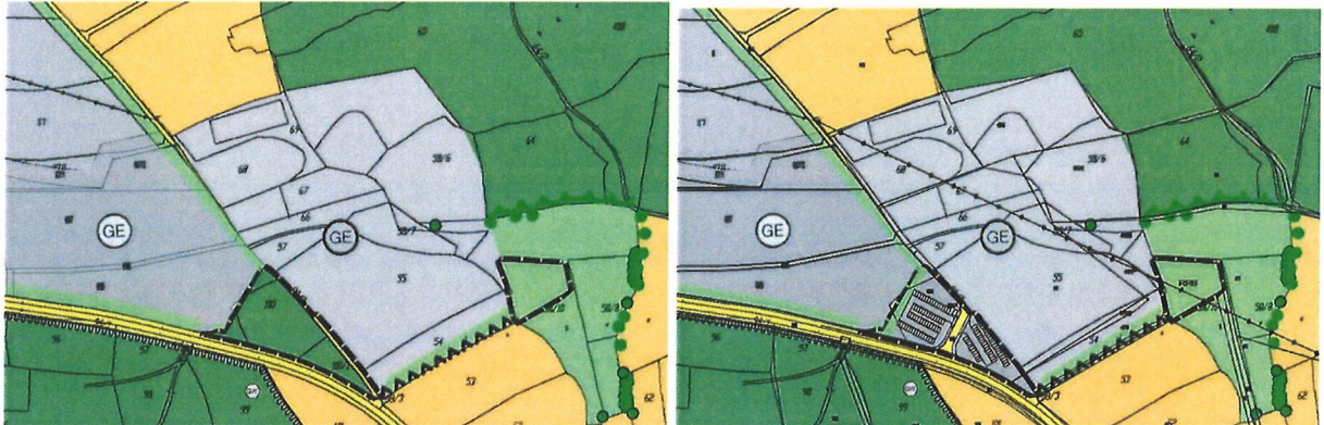
20. Änderung des Flächennutzungsplanes im Parallelverfahren

Auf der Grünfläche der Erweiterungsfläche 2 wird die Abkürzung RRB für die Anlage eines Regenrückhaltebeckens ergänzt.