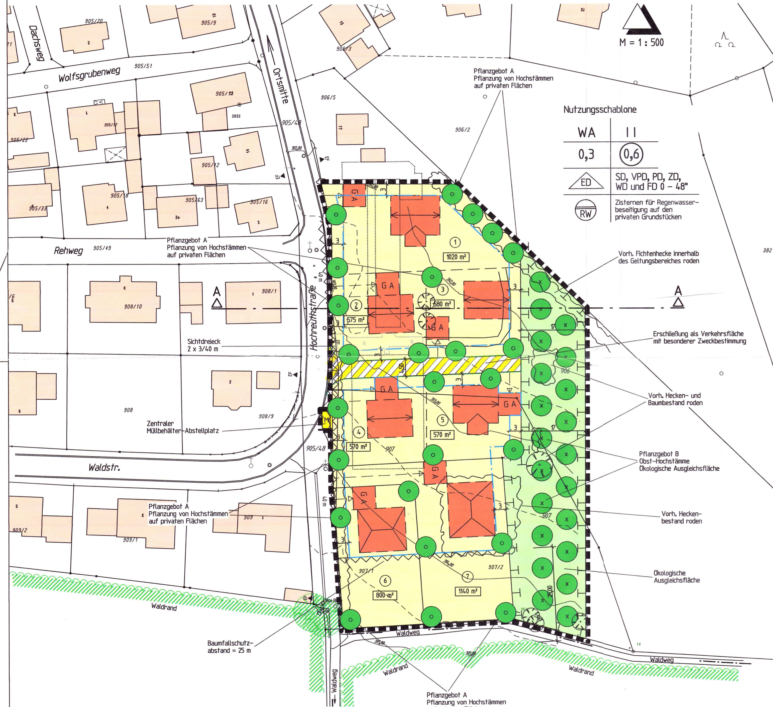
Geländeschnitt A - A, M = 1:500